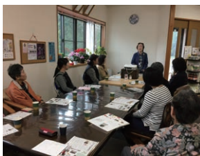
モニター会の様子

ローヤルゼリーモニター会 今年3月、ローヤルゼリーのモニター会を鹿児島で開催しました。10名の主婦の方々にご参加いただき、ローヤルゼリー(シルバー)を1日5粒、2週間飲んでいただき、その報告をいただきました。