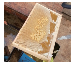
蜜蓋を切り落とした巣枠