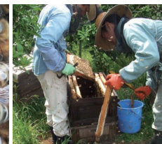
箱から蜜の入った巣枠を取出す