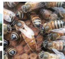
3万～6万匹の蜜蜂の中で女王蜂は1匹