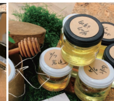
各地で採れた蜂蜜(サンプル)